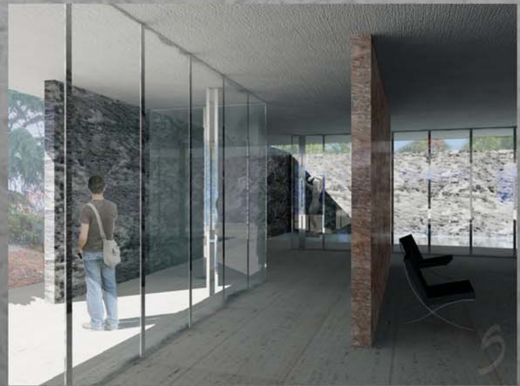
PHOTO COLLAGE INDOORS