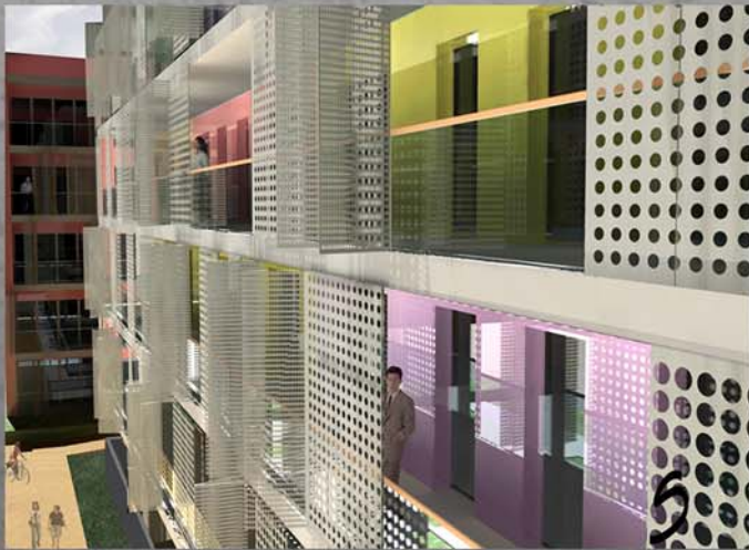
FOTORREALISME VISTES CONCEPTUALS